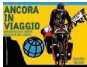
Ancora in Viaggio Diabetes no limits e Povertà no limits

SENSIBILIZZANDO Sulla patologia del diabete